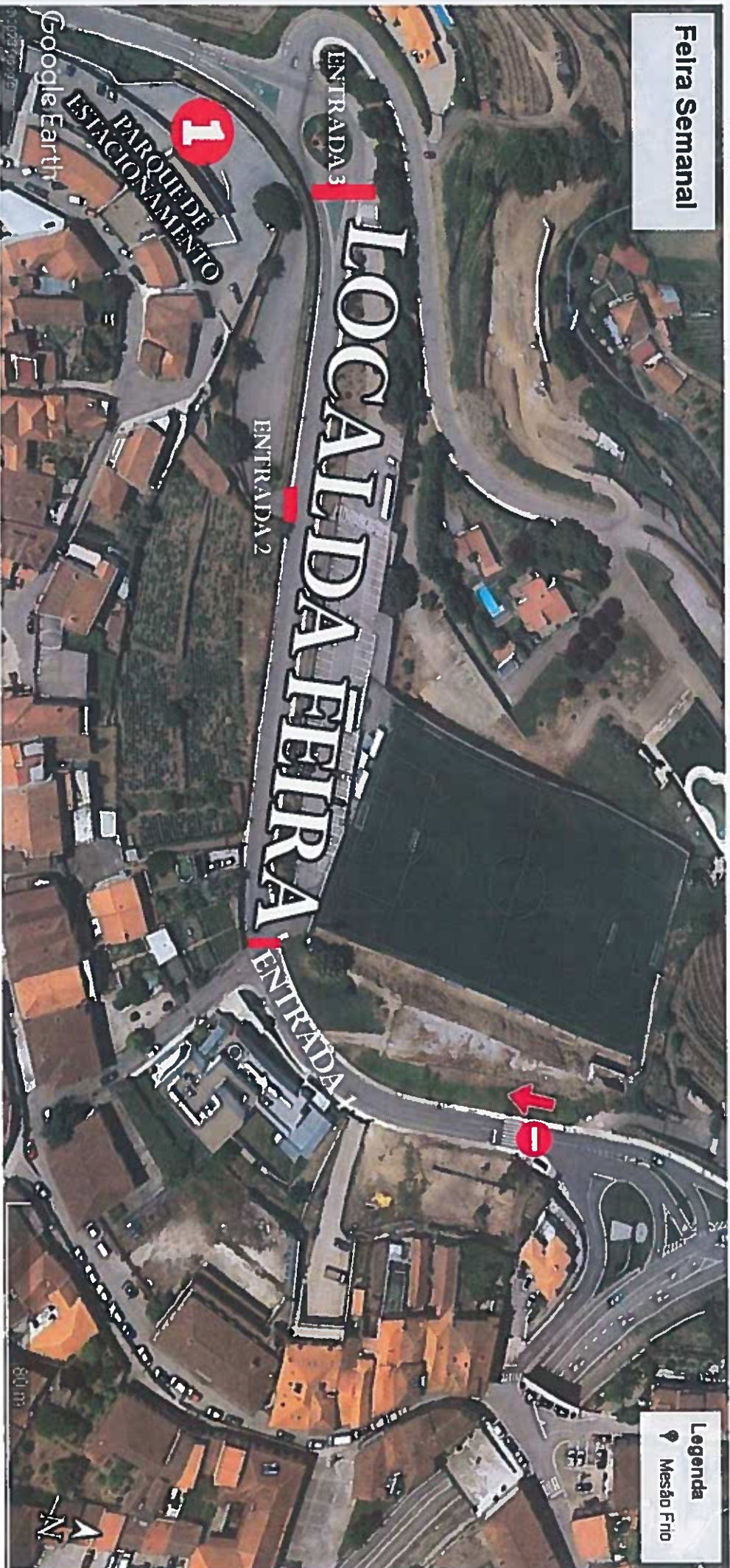
1 - Sala de Isolamento